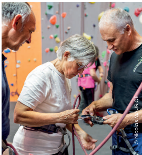
Atelier escalade avec les seniors