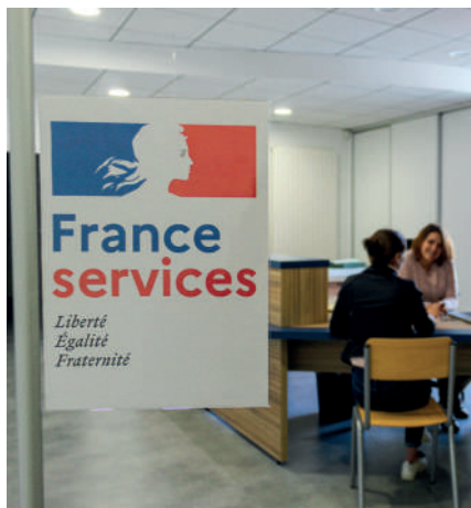
France Services à Mortagne-sur-Sèvre