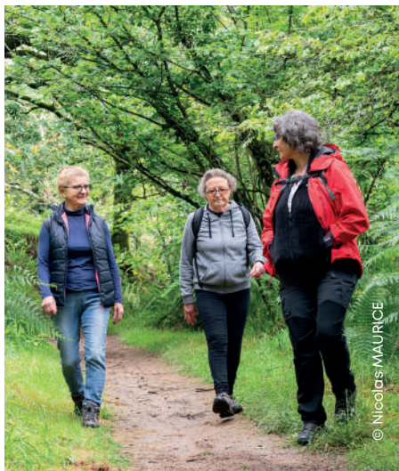
Atelier « Marcher et respirer » pour les seniors