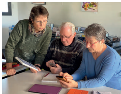
Atelier numérique pour seniors