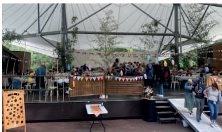
Guinguette des foyers de vie

Porteurs et partenaires privilégiés : Coordinateur CTG et REAAP, service Relais Petite Enfance du Pays de Mortagne, Caisse d'Allocations Familiales (CAF), Protection Maternelle et Infantile (PMI), Structures petite enfance, enfance et jeunesse, Communes membres du Pays de Mortagne, établissements scolaires, La Maison des Adolescents, Mission Locale, éducateur de prévention du département, LAEP, services d'aide à domicile, Plateforme de répit, Maison des Parents, CAP Répit, Pôle Ressources Handicap Maison Vendée Autonomie, Caisse Primaire d'Assurance Maladie (CPAM), Foyers de vie locaux, Centres Communaux d'Action Sociale, Communauté Professionnelle et Territoriale Santé du Haut Bocage (CPTS), Département de Vendée, Agence Régionale de Santé (ARS).