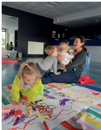
Matinée d'éveil pour les 0-3 ans