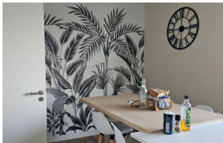
Maison des internes à Mortagne-Sur-Sèvre