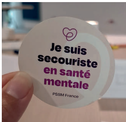
Formation « Premiers Secours en Santé Mentale »