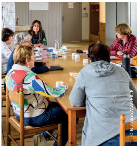
Atelier « Une vie devant nous » pour les seniors