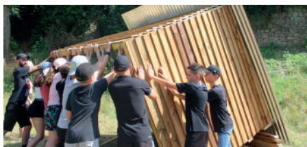
Chantier de jeunes intercommunal