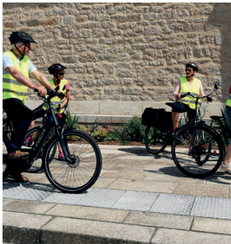
Sortie à vélo avec les seniors