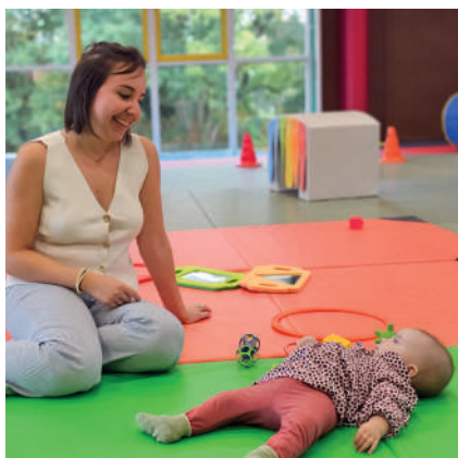
Matinée intercommunale motricité